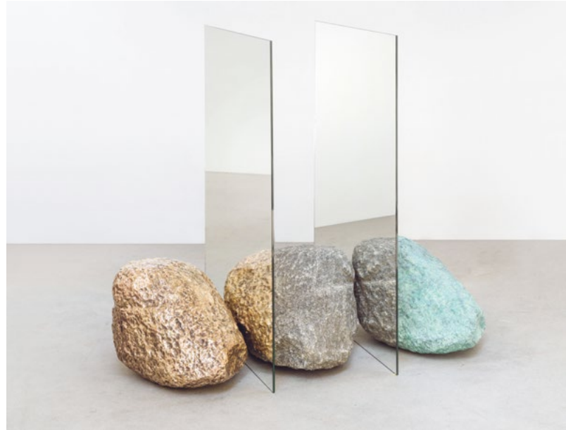
Little Tripple Be-Hide , 2019 Granit, Bronze patiniert, Spiegel 110 x 75 x 110 cm; 43 1/3 x 29 1/2 x 43 1/3 in unique