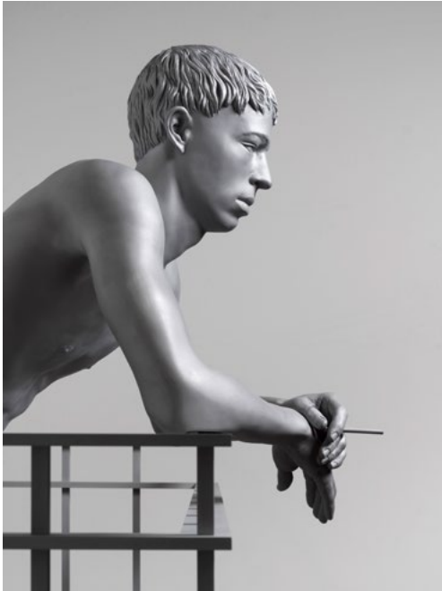
The Observer , 2018 Aluminium, Stahl, Stoff 163 x 144 x 90 cm; 64 1/4 x 56 2/3 x 35 1/2 in unique in einer Serie von drei