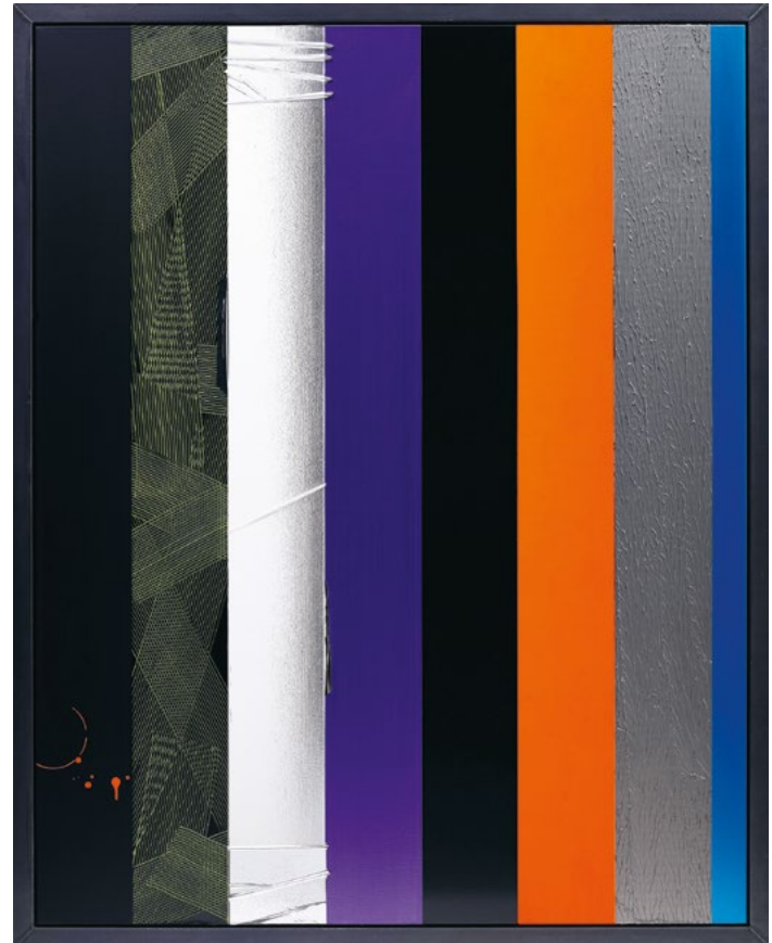
Untitled , 2008 Mischtechnik auf Leinwand, Künstlerrahmen 256 x 205 cm; 100 3/4 x 80 2/3 in unique