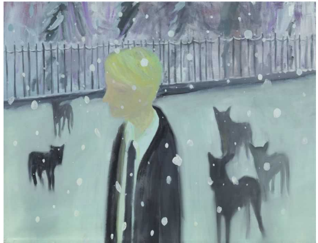
Takeshi Makishima Ohne Titel, 2006 Öl und Acryl auf Leinwand 65 x 72 cm

Ketterer Kunst, Fasanenstr. 70, 10719 Berlin-Charlottenburg