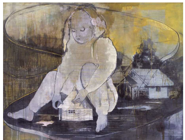
Miriam Vlamming Schlafwandel, 2004 Eitempera auf Leinwand 140 x 180 cm

Die lebendige und facettenreiche Vielfalt verdankt die Kollektion den ganz individuellen Vorstellungen und der Passion des Sammlerpaars, das voller Entdeckungsfreude besonders gerne Künstlerateliers besucht. Gerade der persönliche Austausch ist den beiden Kunstkennern ein Anliegen, denn das Verständnis der Idee, Absicht und Position des jeweiligen Künstlers ist ihnen ebenso wichtig wie das Werk selbst.