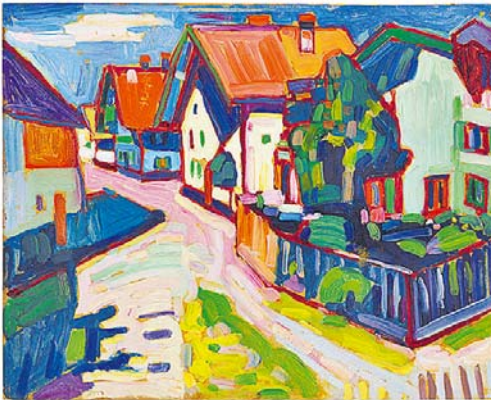
Museumsqualität: Wassily Kandinskys farbtintensives Gemälde „Murnau“ von 1908 auf der Schwelle zur Abstraktion spielte 3.920.000 Euro ein.